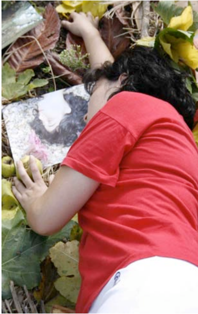
contando historias sin palabras