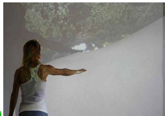
danzando en mi fotografía